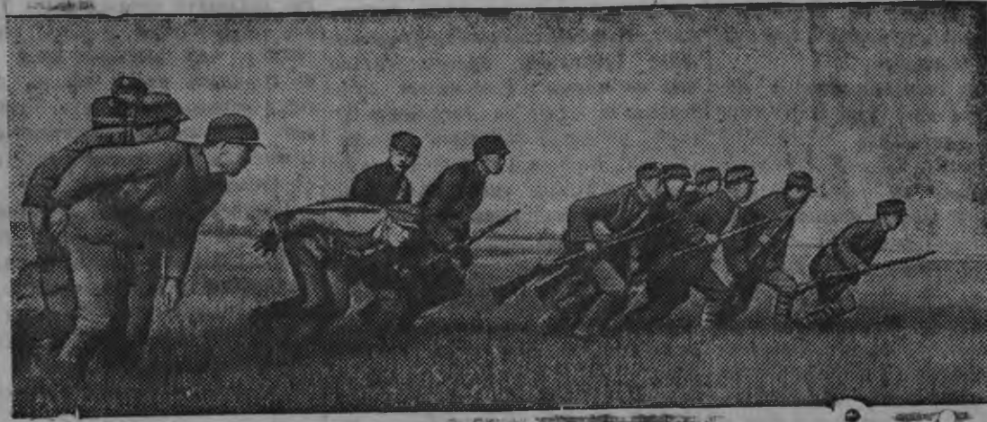
Снимокынь: Китайысь народно-революционной армиялэн боецёсыз наступление мыно.