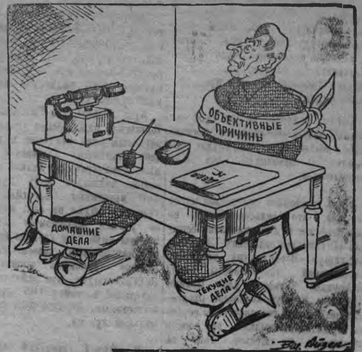
Глазовской районнсы уполнаркомзаг Алексеев октон-валтон дыртя но зернопоставка дыртя но колхозтёсы ёз ветлы. Колхозтёсы истинны понна райкомлы нимыстыз бюро локаладно луиз. Солэн котьку но объективноес мугтёсыз, неотложной ужтёсыз данае.

Первичной парторганизациослэн но райкомлэн инструктортёсызлэн егит коммунисттёсты политически воспитать каронья бадём ответственностсы.