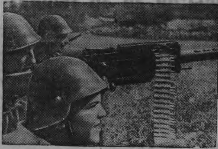
Снимокыи: Республиканской армилэн пулеметчикэсыз