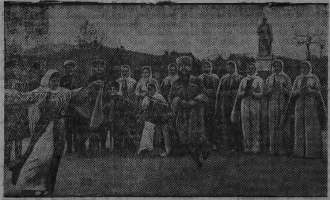
Снимокыи: Этонлэн репетициез

Кабардино-Балкарской АССР-ын национальной кырзан'эсын но этон'эсын ансамбль кылдытэмын