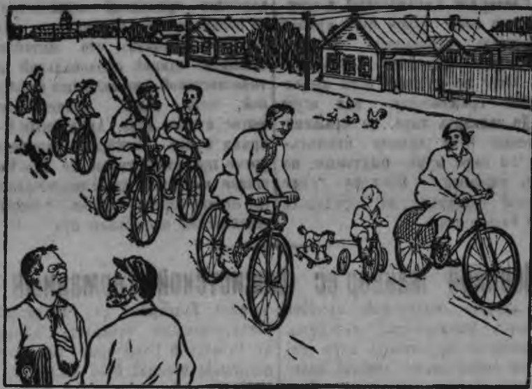
Приезжай: Мар со, велотура-а мара тилдэ орчтытысьёе? Колхозник: Малы! Со мялям комбайнермы Приходьё аслаз семьяныз прогулкае потыз.

«Тросэз колхозникъёс семьязылэн котькуд членэзы быдэ веломашинаос басытыло».