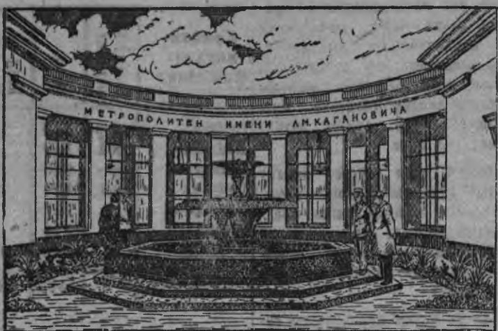
Суред вылын: Метролэн «Сокол» станциялэн тырон азызы.

Москваын Горьковской радиуслэн метроез лезёнлэсь азыло