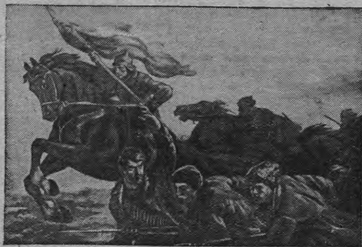
СНИМОВЫН: «Советской родина понна» М. И. Таидзе художник-лен картинаез. «20 ар РККА-лы но Военно-Морской Флотлы».

Москваын «20 ар РККА-лы но Военно-Морской Флотлы» устыськыз художественной выставка. Выставкаын 450-лэс но трос живописной произведениос, скульптураос но графикёс советской искусстволэн мастерёсызлэн.