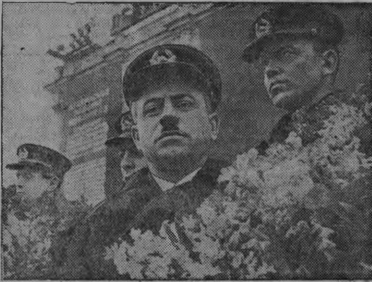
Снимокын: (паллянысен бурпала) Ширинов, Федоров, Папанин но Кренкель эш'ёс Комсомольской площадын ортчем митинг дыр'я трибуна вылын.

Няньзэс государствоы вузась колхоз'ёслы но колхозник'ёслы вуз'ёс вуо. Алигес гинэ Удмуртпотребсоюз 10 нефтяной двигательёс басытэз. Двигательёс 22 вал кужым'емесь. 33 сюрс манетлы клеёнкаос, 33 сюрс манетлы час'ёс басытэмын. Та нунал'ёсы 33 сюрс манетлы час'ёс, 932 манетлы басма вуиз, 284472 манет тыр корт, цемент но цинкованной посуда, 100 велосипед'ёс но 70 кутсаьськон машинаос вуозы. Государстволы нянь вузась колхоз'ёслы 50 автомашинаос вис'ямын.