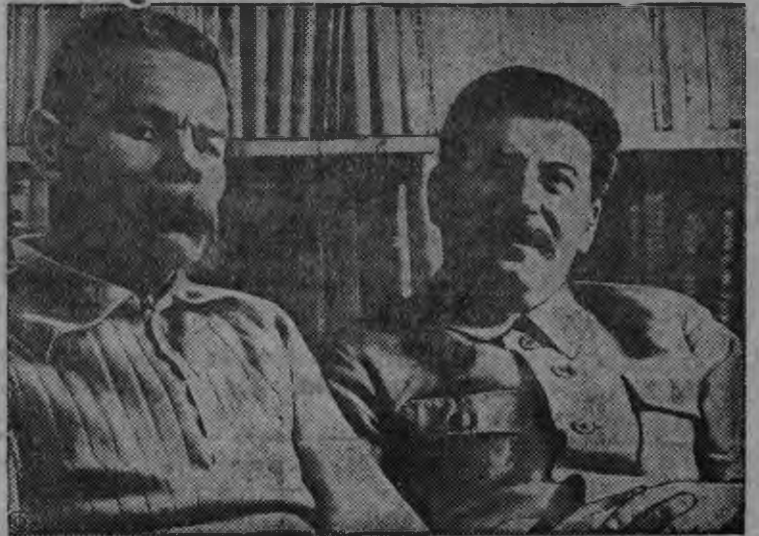
И. В. Сталин но А. М. Горький Горканы шутэтсеков дырызы.

НСШ-ысь дышетис'ёс Кожиль сельсоветысь колхоз'ёсын Горький сарысь лекциос ортчыт'яло.