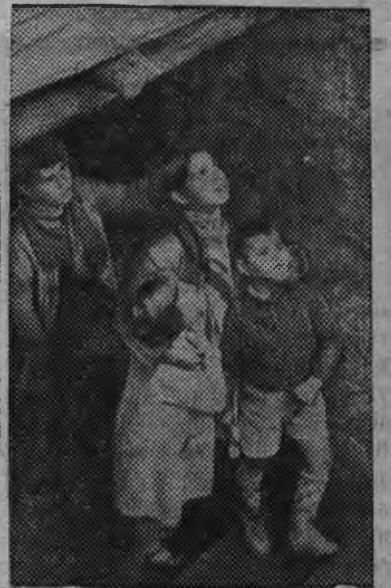
Фашистской самолёт'еслэн явиськон дыр'язы пинал'ёс пег'эзон инты утчалло (Мадрид).

Прокурорлы та ужез жегатскытэк эскероно.