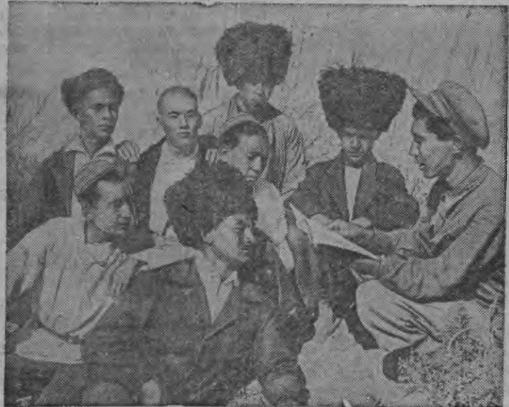
Нарийской районн (Турнменской ССР) участковой агроном Ханыв эш (бурпалан) Третий решающий колхозын бадзым массовой воспитательной уж нуэ. Котькуд уналэ шутэтскон дыр'я газет но журнал колхозник'ёслы со лыдылэ

Кизен азелы образцово дасяськыса 1938 арын эшшо но выли урожай басьтом. Двухдекадник кустын соцшотатсконэз но стахановской движениез массовое каром!