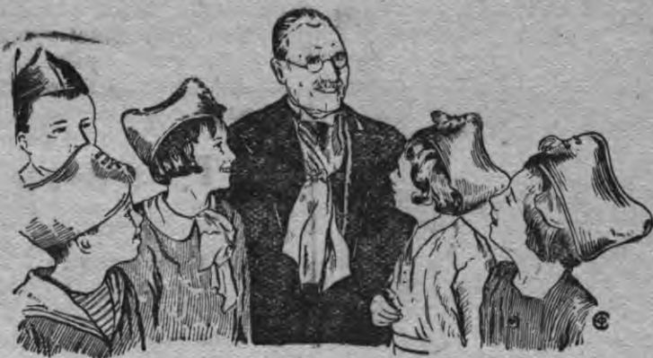
Английской профсоюзной деятель Том Манн пионер'ёслэн октябренок'ёслэн юртазы мыллыосын.

Пионер'ёслэн но октябренок'ёслэн Московской юртазы СССР-е Октябрьской торжество лыктэм иностранной делегациосын пионер'ёслэн пуматаськон'ёсы вал.