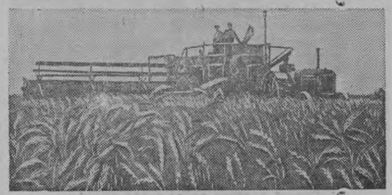
Карл Маркслэн нимыныз нима колхозлэн луд вылаз тьсё культураосыз октон-калтон. (Цюрупинской район, Одесской области)