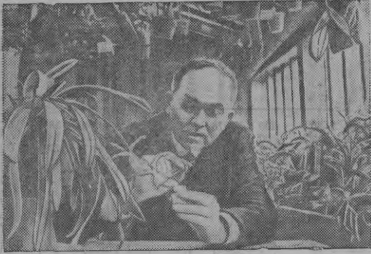
Академик Н. Г. Холодный подопытной растение дорын.

УССР ысь наукаослэн Академизлэн ботаникаезлэн институтез академик Н. Г. Холодныйлэн кивалтэм улэз растительной гормонёсыз растенилэн будонэныз управлять нарыны интересной опыт'ёс лэсьтылэмын. Туз институт посевной материалэз гормонализация паськыт опыт лэсьтоз