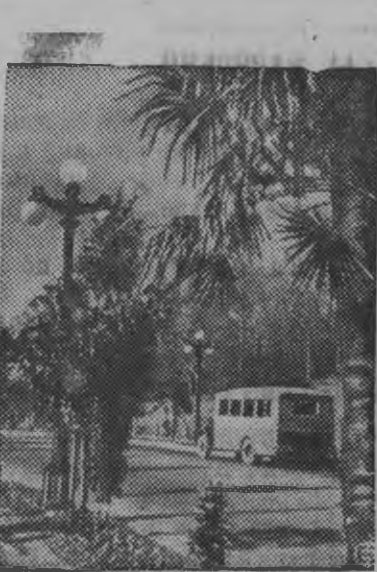
„Дендрарай“ Парк-дорын Сочи-Моцеста австрострада.