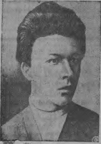
В. И. Ленинэн братыз Александр Ильич Ульяновы 50 ар тырмиз казнить карем дырысы (20 май 1887—1937 ар).