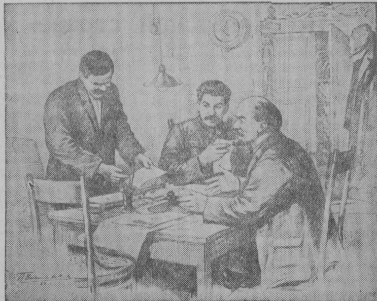
В. И. Ленин, И. В. Сталин да В. М. Молотов, „Правда“ редакцияын.