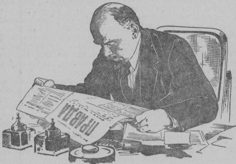
В. И. Ленин 1918 годӧ аслас кабинетын лыддӧтӧ газета „Правда“.

Большевистскӧй печатльӧсь лун отечайтӧк массаэз пондас видзӧтны миян печатльӧсь, миян газетазлӧсь достиженӧез и отечайтны нылӧсь недочӧттэз, медбы печатльӧн уджалӧссез вермисӧ чужажык нӧй бӧрӧтны.