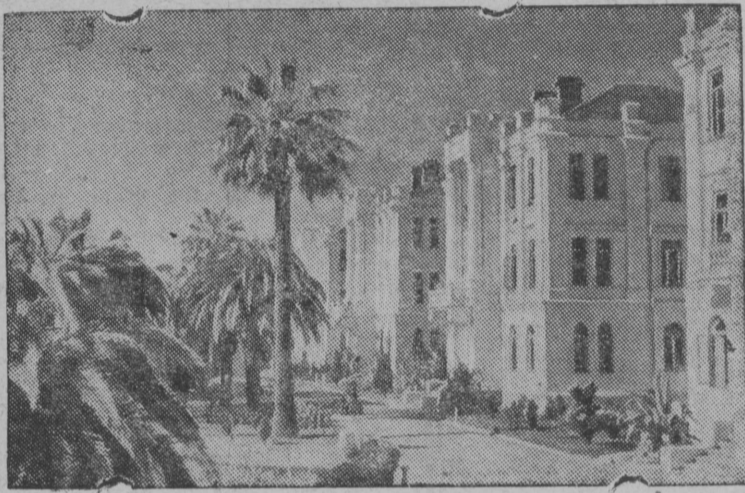
Ленин нима санаторийлбн зданнб Гульрийшын (Абхазскoй АССР-лбн Сухумскoй район).