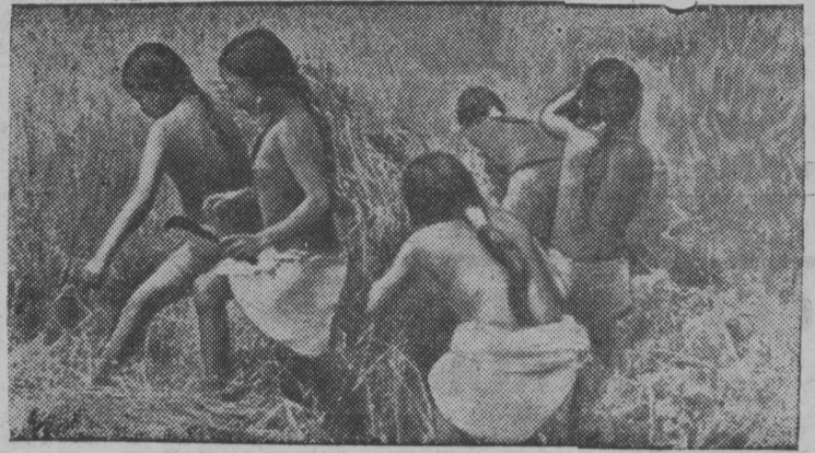
Коняк племяис челяддэз (Бирма) дзимлялбны рис. ТАСС-лбн Фото-клише.