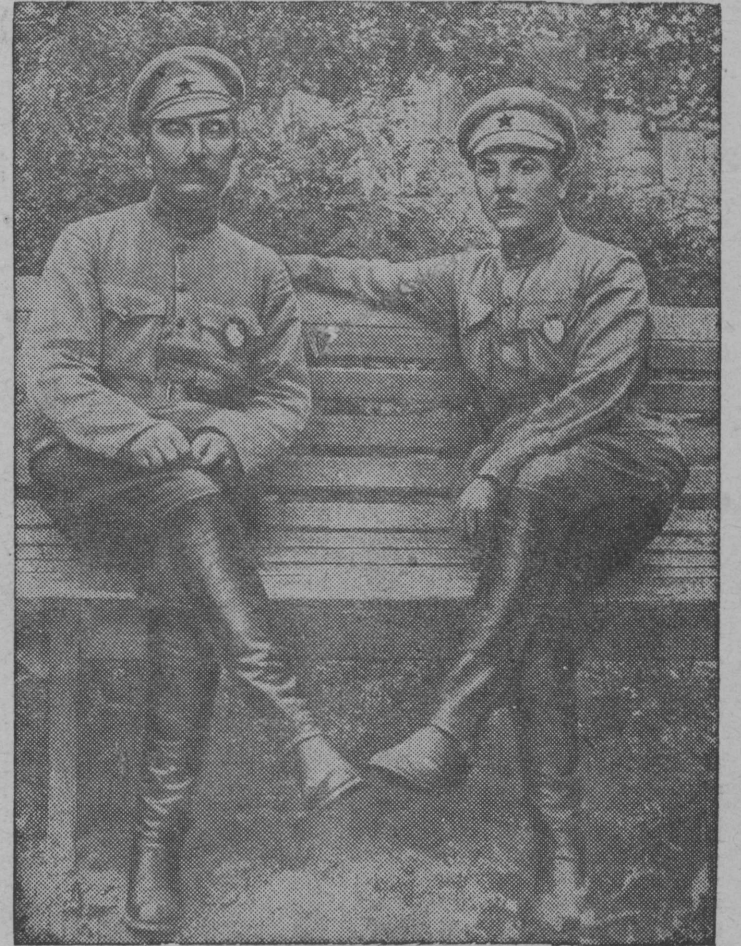
Талун тырис 20 год сэксянь, кызд Красной Армия освободитис Украинабс белопольскӧй оккупация увтис. Белопольскӧбс рӧгromын решающей роль орсис Первой Конной Армия.