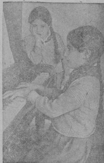
Баку городисӧ Шаумяновскӧй районлӧн Культура Дворецын организуйтӧм челядьӧез бесплатнӧй велӧтӧм орены пианинон. Велӧтӧны орены нефтеперегоннӧй заводдэзисӧ рабочӧйезлӧн челядь 200 морт мымда.

Талун олимпиада вылын концерттӧз продолжайтӧны.