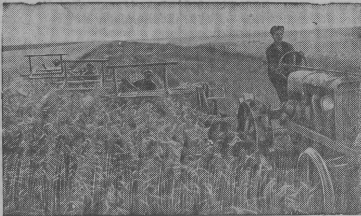
СталинградскӢй областись, КолачевскӢй районись „Волна революция“ колхозын рудзӢг вундӢны лобогрейкаезӢн.