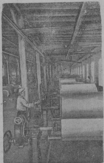
Энсо городись целлюлозно бумажнӧй комбинатлӧн „Эсонит“ картон керан цех (Карело-Финскӧй ССР).

КОУРОВ, Кудымкарскӧй районись Полвинскӧй территориальнӧй комсомольскӧй организациялӧн секретарь.