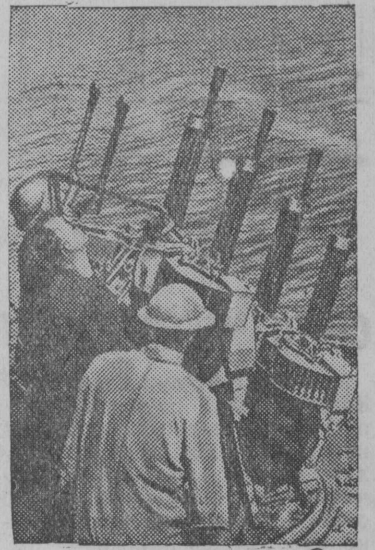
Английской миноносец вылын зенитной пулемёттэз.