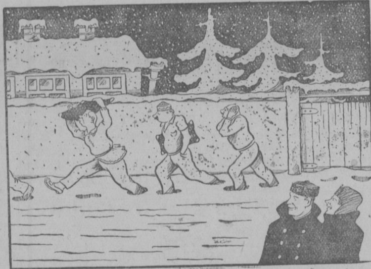
—Кысынь этэ ния гожумсы паськомон котөртонны? —ВЛКСМ Кочевской райкомлөн совещаннэ вывсынь, кэда гожумнас пондөтчис, а талун кончитчис. Заседайтканэсы лыжааз эз заптэ. Сийон районэс лыжной соревнованнээз кежэ тренируйтчыны дзик только 87 морт.