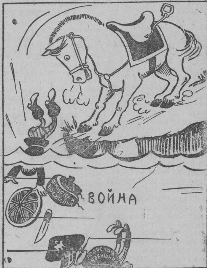
Вот Фома идет на дно, А Ерема там давно.