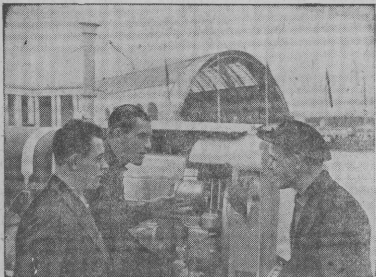
В павильоне механизации.