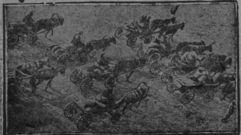
Горд обо- зэн ю ваи- зы

Кылемаз номерын (42) «Русских эшлэн докладсьтыз» шуса гожтэтын пöясськыса: «... 5 га муз'емлы одйг агроном гожтэмн. «5000 га муз'емлы одйг агроном» ... шуса лыд'ёно