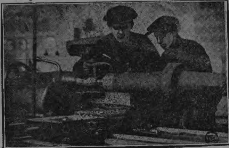
Челябтракторстройын „Катерпиллер“ нимо туж кужмо тракторлы частьесэ лэсьто. 15-тӱ февраль азелы ачиме лэсьтӱм частьесыс кык трактор тырыса-лэсьтыса вуттӱмын луоз.