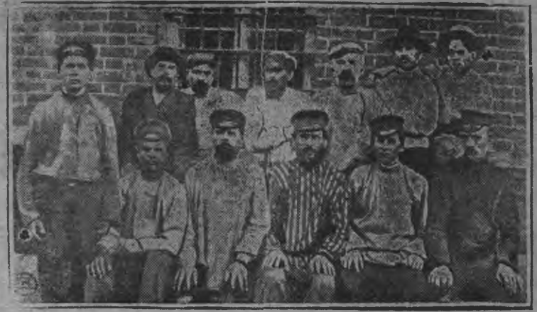
1905 тӧ арин вӧсстать карем кресьян'ӧс харьковской тюремн

Быдэс дуннейын пролетар кужым ворымтэ на. Быдэс дуннейс вичак тӧдыв, ӧж калык'ӧс Ленинлэн знамя улаз султыса жӧген мировой Октябрь лэстызы, аслэвылы эрик басытозы.