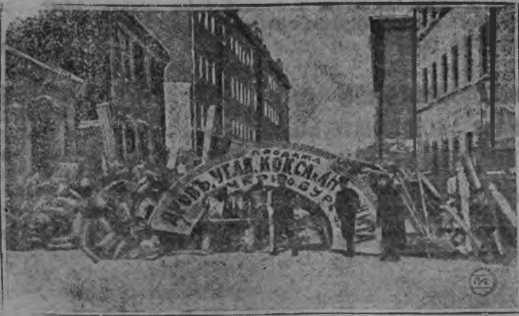
1905 арын Москва карын М-Бронной ульчани ужасьёслын лэстытэм баррикада.

Нош Ленинлэн дышетэмез'я 1905-тй аре луэм революци та'че бад'ым урок-сэ сётйз: большевик парти гинэ ужасен-кресьянэз социализме нуыны быгатов. С. Максимов.