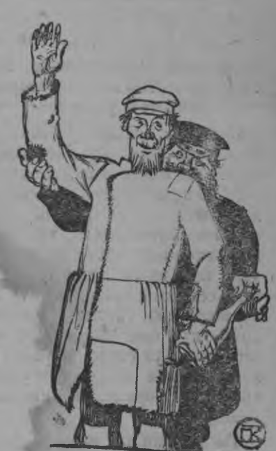
Тачес ачизалэс голоссөс одиг бутулка кумушкаен гуртмыжкылы вуэало.

Совет'ёсы умойёсөз партиец'ёсты но комсомолец'ёсты быр'ини дасьтоно.