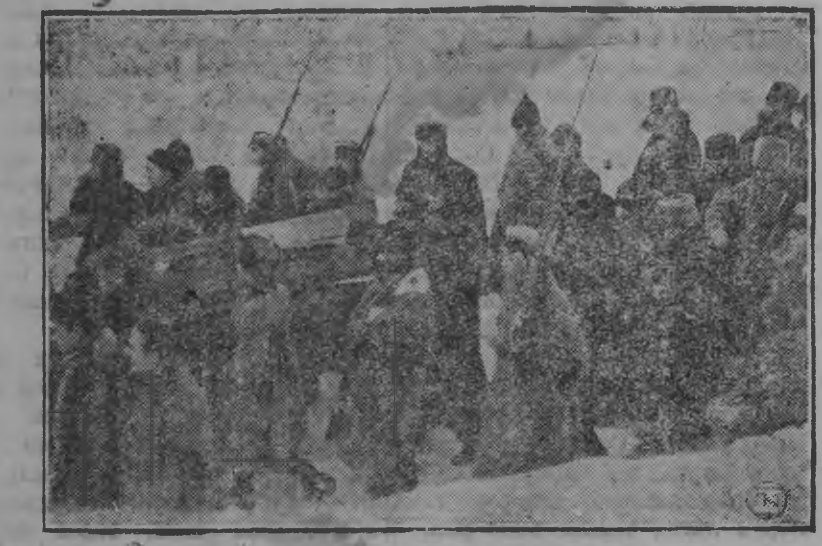
Горки станчийн Ленинлэсь гробэз поезд доры нуэ.

Кытэйтйэз бригадэслэн янгышсы—гуртысь калык'ёсты люкылон бордысен потэ. Бригадэслэн кудиз ужасьёс гурт'ёсысь гурт-