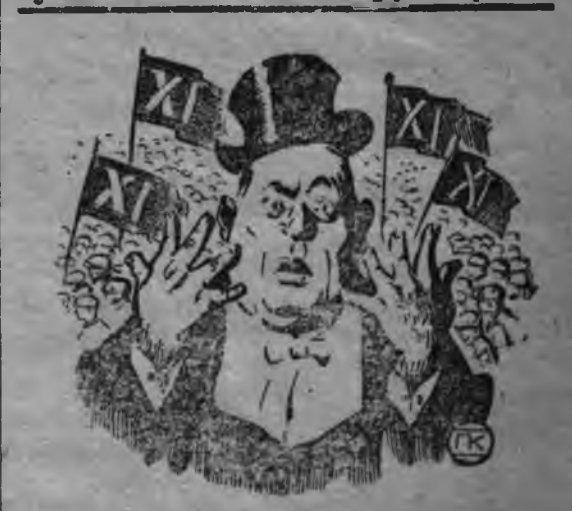
Кенешо власэсь улэм арзэ лэд'яны капиталыстэн чинывез уг окмы инй

Ягошур вол. Котомка гуртын кылем тулыс гинэ семеноводческой эш т о с кылдытэмын. Солэн кылдэмез кемаласэ ке но овёл, ёвчэз трөс гинэ адске инй. Тани соёс: ёг кызыны 625 пуд суперфосфат басыт'яны. 12 плуг, кутсасыкон машина (приводэн), аран машина, сортировка басытэмын инй. 7 корказ коллектив кылдытызы инй. Узур'ёсыз гинэ уез тарганы вутско. Начар'ёсыны одйг кылысь карисыкыса узур'ёслэн тарганы кутскемылы зол-зол пумит султоно. Гурткор.