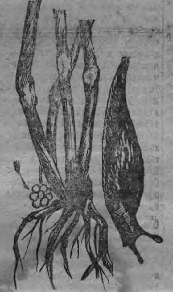
Паллян палаз кылялюлылэн пуз'ёсыз. Бурпалаз кылялюлы