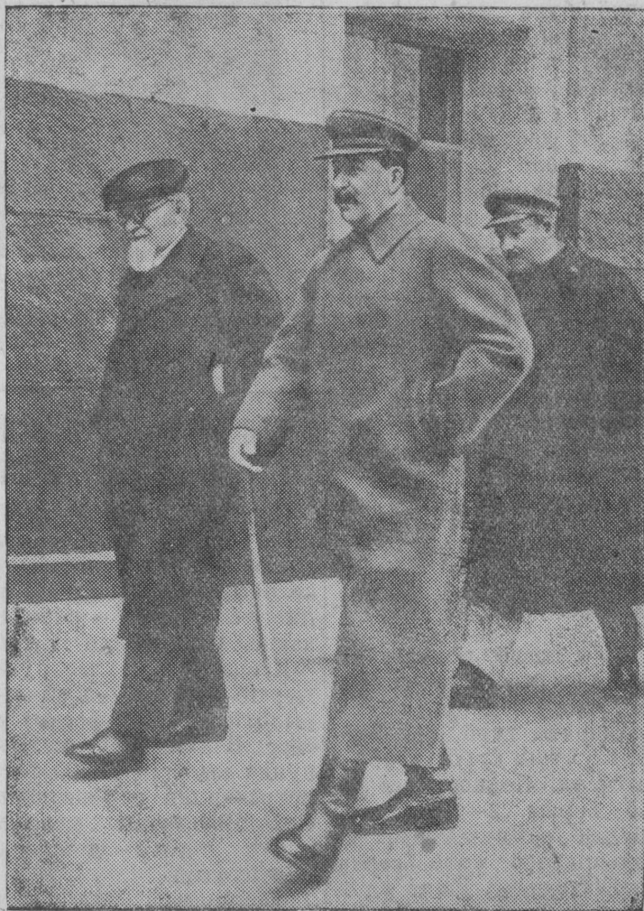
На снимке: Товарищи И. В. Сталин, М. И. Калинин, Л. М. Каганович направляются из Кремля на Красную площадь.