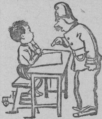
В семье пожарника.

— Ты обещал домик нарисовать горячий и пожарников, а на бумаге ничего нет... — Домик сгорел. — А пожарники?.. — Еще не приехали... Рисунок М. Серпякина.