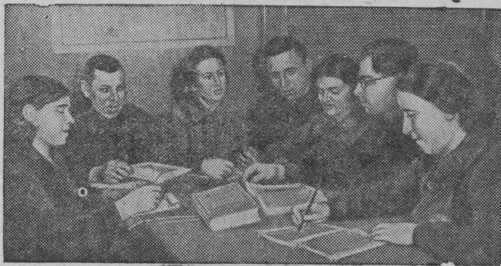
Занятия кружка по изучению Краткого курса истории ВКП(б) при Очаковском кирпичном заводе (Кунцевский район Московской обл.)

Партия, советскбй пра-вительство да миян любя-мбй вождь эрт Сталинбыд лунб заботитчбны сы йл-лбсь, медбы годбсь годб колхозниккес, быдбс совет-скбй народ олбс богатбй-жыка, культурнбйжыка, медбы колхозээз сетбсб сельскбй хозяйстволбсь унажык продуктаэз. Миян кыззын и миян вын сббртб тыртны этб задачасб. Пон-дам жб уджавны сибз, кызд велбтб миян велбтбсь вели-кбй Сталин!