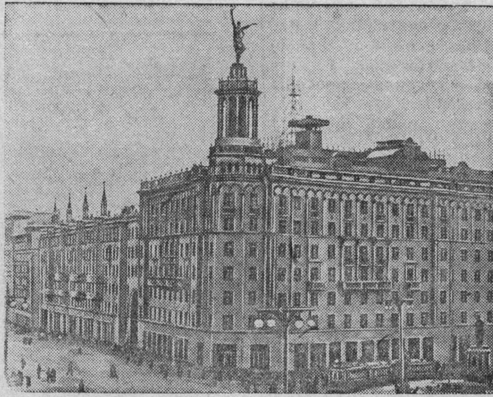
Корпус „В“ на углу улицы Горького и площади Пушкина.