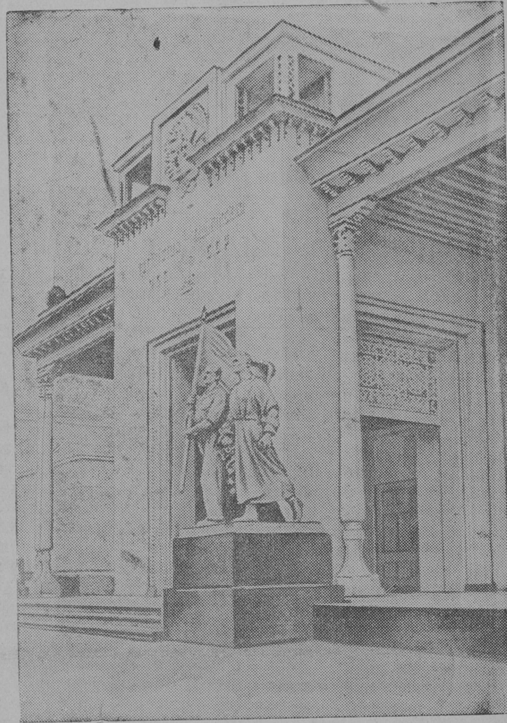
А снимке: Павильон Таджикской ССР.

Всесоюзная Сельскохозяйственная выставка.