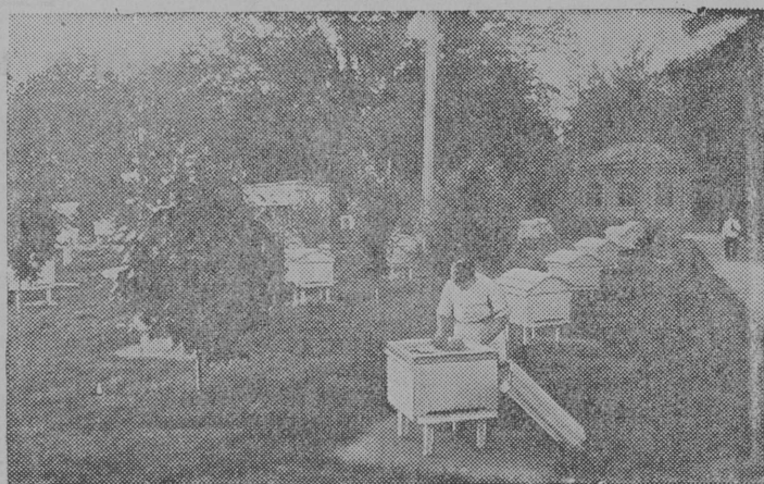
На снимке: Показательная пасака при павильоне „Пчеловодство“.

ские лимоны и вятские мандарины. Лимоны будут расти в Перми и в открытом грунте. Гений сельскохозяйственной науки Мичурин учил нас не ждать милостей от природы, а покорять ее.