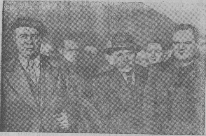
Снимок ылын: (шугьгалавсьянь веськытлань): Андрэ Марти, Марсель Капел, Морис Торез панталаны боецезэс Парижись вокзалын.

Республиканскэй Испаниясь Францияэ локтисэ интернациональнэй бригадаись боецез.