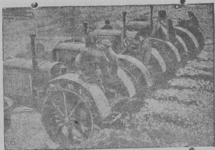
НА СНИМКЕ: Тракторный отряд МТС

Polujanov kulakēs kolē āni-zē čapkņ kolhoziš da pukšētņ sud skāmja vāļ. K