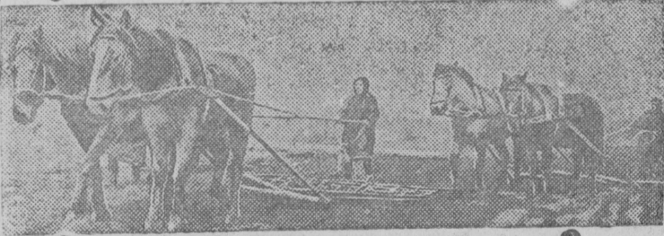
НА СНИМКЕ: Борьба зяби перед посев м льна в годхозе им. Сталина, Углического р-на, Иван. облеси.