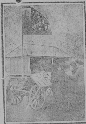
На снимке: Выдача литературы в колхозе «Красный Терек» Георгиевского р-на (Сев. Кавказ).