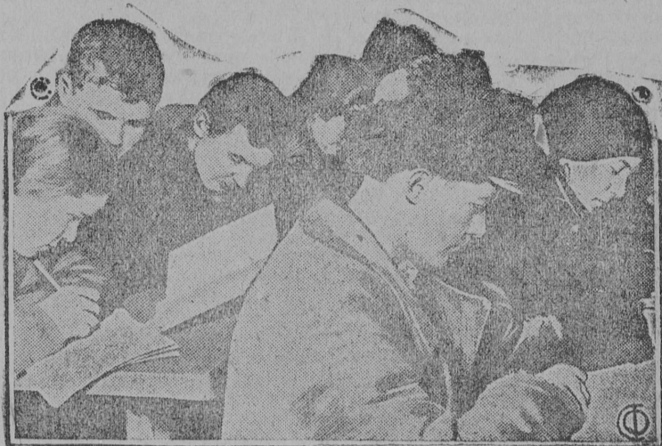
На снимке: Занятия на вечернем рабфаке в Самарском зерносовхозе