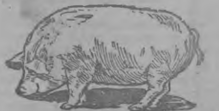
Редактор Я. И. Ельцов

частично на Ярскую МТС. Нашелшему и доставившему будет выдано вознаграждение в размере 200 рублей. Адрес: г. Глазов, ул. Энгельса, д. № 16, Чертяжная ГЗЛ.