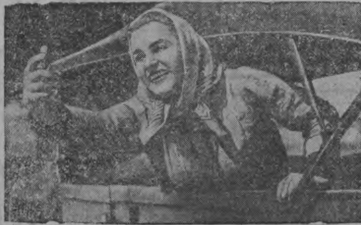
Фильмысь кадр. РСФСР-лэн заслуженной артисткаез В. Марецкая—колхозница Александра Соколовалэсь главной рольэ исполнять каре.

„Ленфильм“ студиялэн виль кинофильмез „Член правительства“.