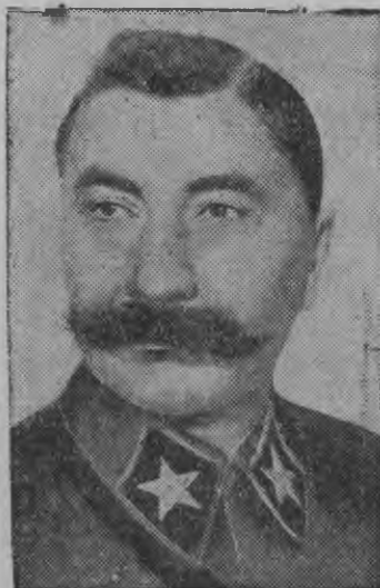
Советской Союзлэн маршалэз С. М. БУДЕННЫЙ

Родина понна, коммунизм понна, Сталин понна киружие кутыса нюр'яськон — Советской патриотизмлен высшой честе. Жугиськон кырын батырлык уж нырсырьс асьмелэн миллион'ем мурт'ес мечтат каро, кной пионер'ес но трудлен ветерант'ессыз. пиос но выл кышшоос мечтат каро.