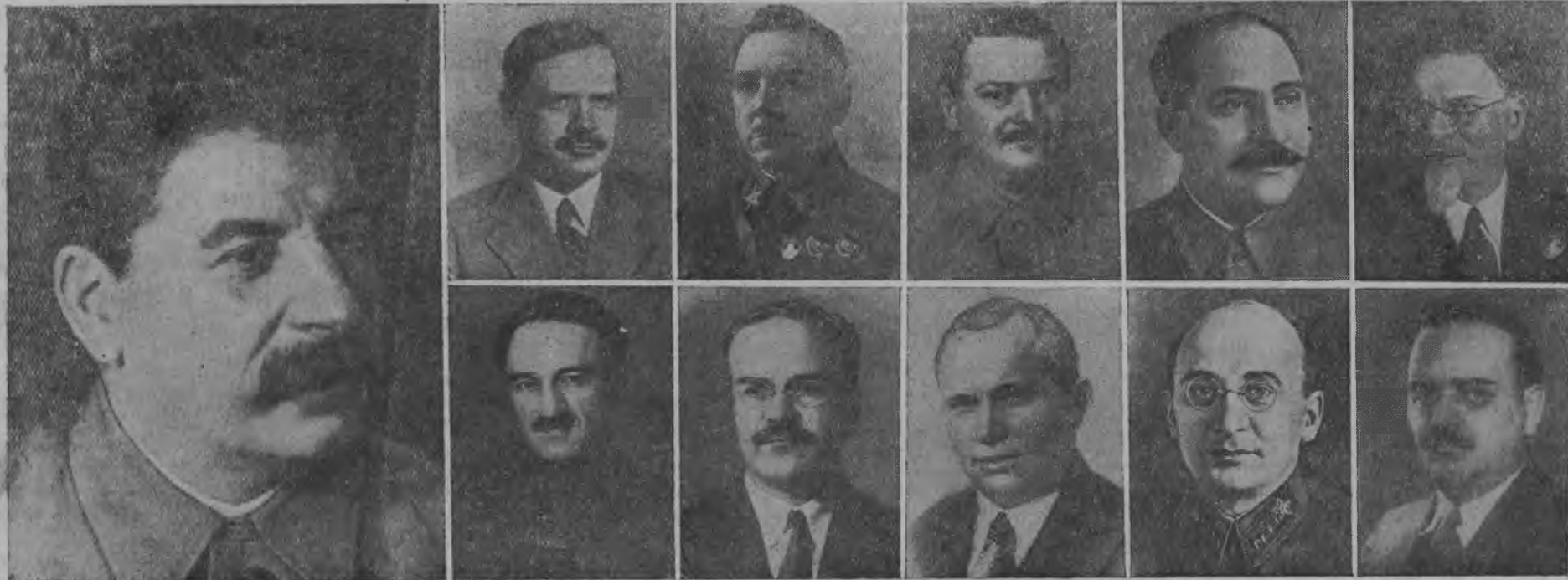
Фото тоын (паллянысен буре) И. В. СТАЛИН, А. А. АНДРЕЕВ, К. Е. ВОРОШИЛОВ, А. А. ЖДАНОВ, Л. М. КАГАНОВИЧ, М. И. КАЛИНИН, А. И. МИКОЯН, В. М. МОЛОТОВ, Н. С. ХРУЩЕВ, Л. П. БЕРИЯ, Н. М. ШВЕРНИК.