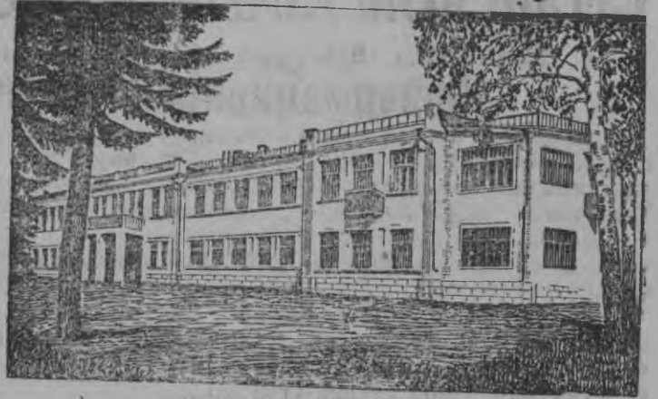
СУРЕД ВЫЛЫН: 2-ти № ро детяслилы лэсьтэм выль корка.

Реутовын (Реутовской район, Московской обл.) 2-ти № ро детяслилы выль корка лэсьтэмын Реутовской прядильной фабрикаос рабочийёслэн но служащойёслэн пинал'ёсызлы.