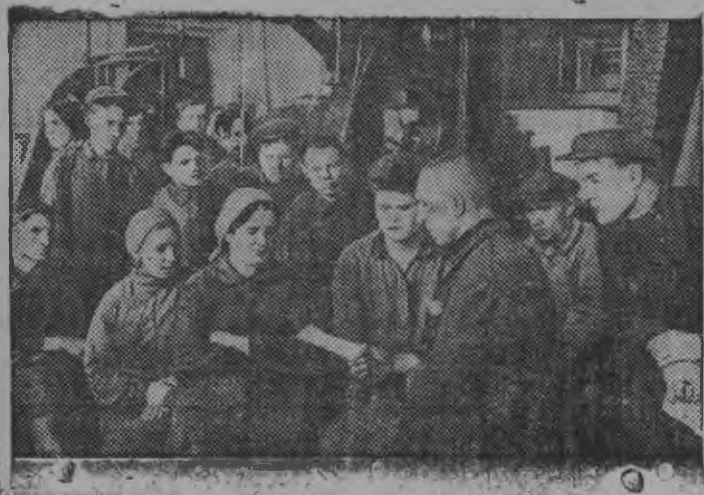
Суред выльн: Куйбышевлэн нимызы нимам стан-костриотельной заводлэн кыктэти механической цехын ужасьёс обеденной перерыв дыр'яз быр'ийськон положение дышетско.