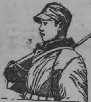
СУРЕД ВЫЛЫН: Китайской армиялэн боец'ес.