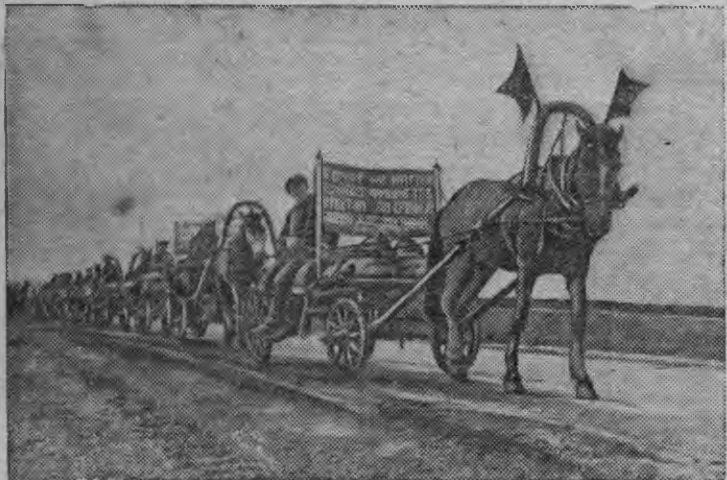
„Красный партизан“ колхозлэн горд обозэз.

Гитлеровской бандит'еслэн подлой нападенизылы ответэн, Свердловской областысь Петрокаменской районьсь колхозник'ес горд обоз организовать каризы. Туэ ар понна хлебопоставкае дырылзсь азыло государственлы сдать каремын вуж урожайысь 700 подводэн ю тысь.