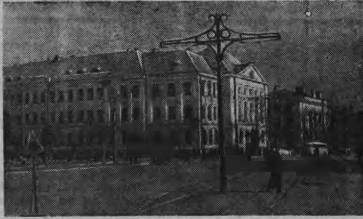
Таллинын Победа нимо площадез