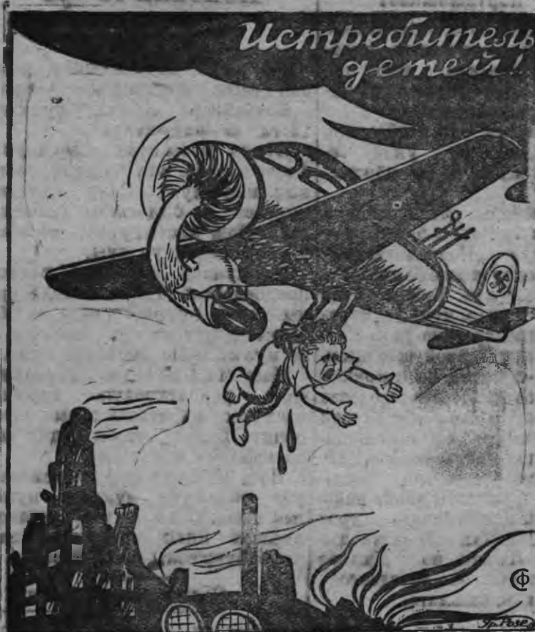
Фашист- ской авиа- циялэн ту- сыз.