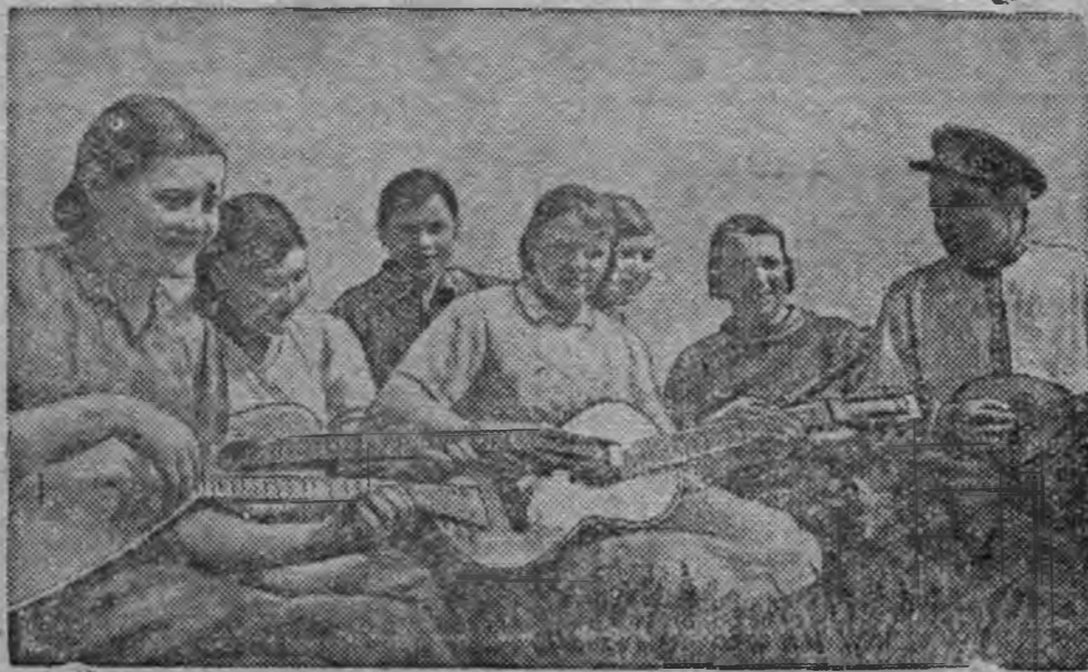
Лудысь станын. Селявки эшлэн бригадысьтыз тракторист'ёс но-прицепчик'ёс обеденный перерыв дыр'я шытэтсконнын.

Сальской районьсь (Ростовской область) Селявки эшлэн азьмынсь тракторной бригадаез (Сальской МТС) систематически нормазэ быдэс'я но горючеез эконсмить каре. Бригадаын умой но культурно организовать каремын шытэтскон дыр.