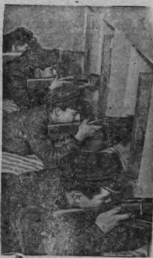
Москваысь Ленинград'сы комсомолец'еслэн зночной стрел-ковой соревнованызы.

Новостройкаос 1941 арын — яркыт свидетельстволэ социализм-лэн кужымезлэн будэмез сярхысь.