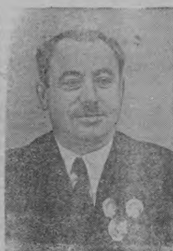
Суред вылын: паллянысен буре: „Седов“ ледоколлэн капитанэз К. С. Бадигин, „Седов“ ледоколлэн старшой механикэз—помполитэз Д. Г. Трофимов но „И. Сталин“ ледоколысь экспедицилэн начальникэз—Советской Союзлэн Героизэ, И. Д. Папанин.