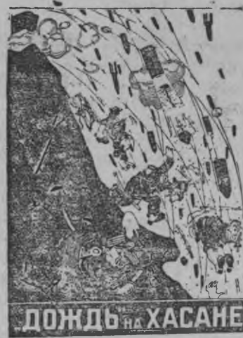
ДОЖДЬ НА ХАСАНЕ

Быдэс мир азын оскандалиться кариськыса, японской военищина выкручиваться кариськыны кутскиз. Кызы ке аслаз сранаез азын отчитаться кариськоно вел. И вот асьсэлэн газет'ёсазы гож'яны кутскизы, что сослы зор люкетйз. Но со тольк калыкы өз вера, кыч зор сырьсь вераськоно мынэ. Советской территория вылэ кылыны солы д йствительно зор люкетйз, тольк еорошилловской залп'ёсын ыбылэм свинцовой зор". (ВКП(б)-лэн XVIII съездаз Л. З. Мехлислэн верамысьтыз).