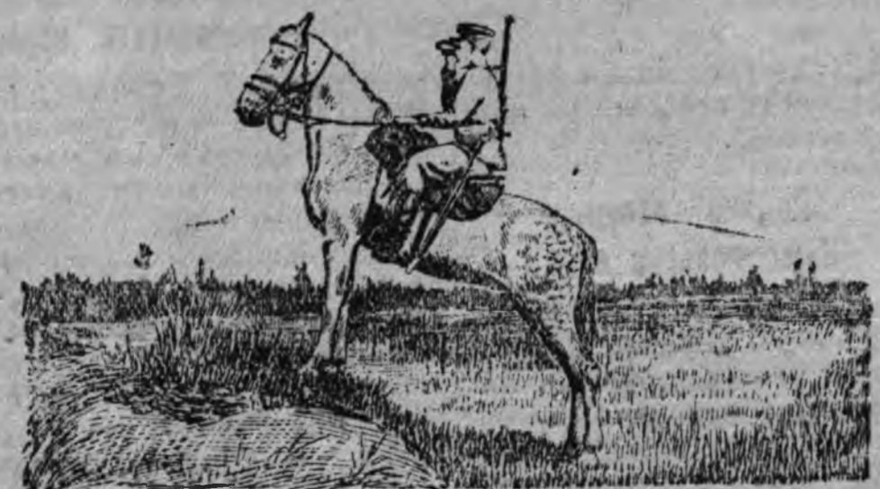
СУРЕД ВЪЛЫЧ: Н-ский аставайсыз пограничник дозорын.