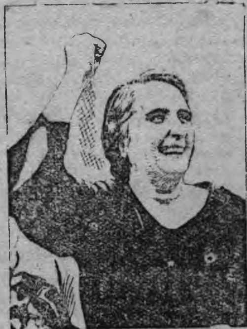
Джэргэс Ибарури (Пассионария)

Етйнлэсь но пышлэсь урожайностьсэ жутоньн большевистской план юнматэмын. Та планэз быдэстыны дыраз дас'яно минеральной удобренности, пень, торф но мукет кидыс. Етйн продукциялэн улй качествоныз бере кылёнэз решительно быдтоно.